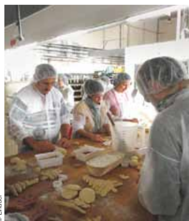
Bei den beliebten Backkursen geben Profis den Teilnehmern wichtige Tipps.

Mark & Mark hat mit Feinbäck einen eigenen Markenauftritt für die Endkonsumenten entwickelt. Im ersten Schritt wurde die Marke Feinbäck für das Krapfen-Portfolio umgesetzt. Die Sorten „Marille“, „Vanille“ und „Nougat“ sind bereits im Lebensmitteleinzelhandel erhältlich, weitere Feinbäck-Produkte sollen folgen.