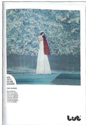
Bronze für Reichl und Partner (li.) und Jung von Matt

Gemeinsam holten sie vier der begehrten Statuetten nach Österreich. In der Kategorie „Press“ wurde Reichl und Partner der bronzene Löwe überreicht. Ausgezeichnet wurden die Arbeiten „Explore Your Dreams“, „Be The Tailor Of Your Dreams“ und „Be The Painter Of Your Dreams“ in der Kategorie „Press“ für den Kunden List General Contractor. Jung von Matt/Donau erlegte das Raubtier in Bronze in der gleichen Kategorie mit den Sujets „Smart for Two Snake“, „Smart for Two Yoko“ und „Smart for Two Jackie“ für Smart. Der „Presse“-Grand