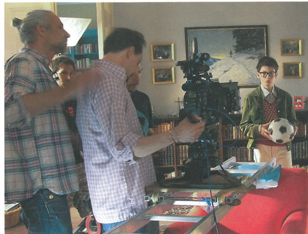
Der Aufwand an Technik und Personal ist größer, als man meinen möchte