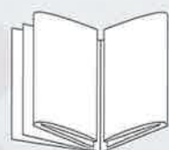
1 Panorama Slim XL