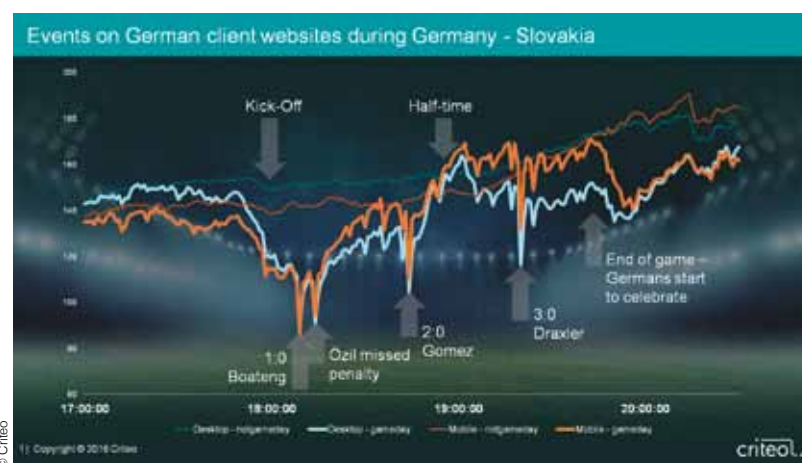
Analysiert wurden die Website-Events während des Spiels Deutschland-Slowakei.

WIEN. Die EM neigt sich dem Ende zu, das Finale steht kurz bevor, und unser Team ist bereits seit Wochen wieder zuhause. Das Ausbleiben des Erfolgs der ÖFB-Elf hat das Technologieunternehmen für Performance Marketing, Criteo, aber nicht davon abgehalten, seine Untersuchungen durchzuführen. Analysiert wurden sodann die Deutschen. Konkret ging es darum, zu messen, welchen Einfluss der Spielverlauf auf das Einkaufsverhalten der Fußballfans über die 90 Minuten und darüber hinaus hat. Criteo hat die Events auf Produktseiten von etwa 1.000 deutschen Onlinehändlern während des Achtelfinales gegen die Slowakei analysiert und sowohl mit den Events während einer normalen Woche sowie mit anderen Spielen verglichen.