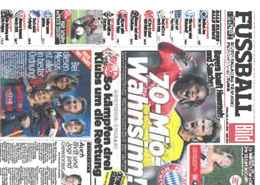
Ein Dummy der Fußball Bild mit noch nicht aktuellen Inhalten.

Das Bekenntnis zur täglichen Publikation rein für den Sport schließt dabei in Deutschland eine Lücke, die gleichnamige Fußballlabel aus dem Hause Kicker erscheint nur zweimal pro Woche, ist aber international kein Novum: vor allem die als enthuasierteste Fußballfans bekannten europäischen Stützländer sind mit täglichen Printprodukten bestens vertraut. Pa-