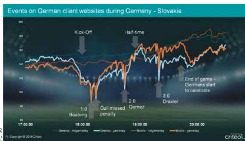
Analysiert wurden die Website-Events während des Spiels Deutschland-Slowakei.

WIEN. Die EM neigt sich dem Ende zu, das Finale steht kurz bevor, und unser Team ist bereits seit Wochen wieder zuhause. Das Ausbleiben des Erfolgs der ÖFB-Elf hat das Technologieunternehmen für Performance Marketing, Criteo, aber nicht davon abgehalten, seine Untersuchungen durchzuführen. Analysiert wurden sodann die Deutschen. Konkret ging es darum, zu messen, welchen Einfluss der Spielverlauf auf das Einkaufsverhalten der Fußballfans über die 90 Minuten und darüber hinaus hat. Criteo hat die Events auf Produktseiten von etwa 1.000 deutschen Onlinehändlern während des Achtelfinales gegen die Slowakei analysiert und sowohl mit den Events während einer normalen Woche sowie mit anderen Spielen verglichen.