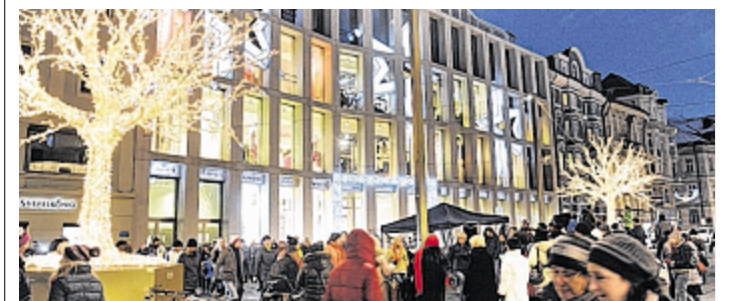
Der 8. Dezember ist einer der umsatzstärksten Tage im Weihnachtsgeschäft. Wer an dem Tag arbeitet, hat ein Recht auf Lohnzuschlag.

Am Land würden ohnehin nicht so viele Geschäfte öffnen wie in den stark frequentierten Städten. Auch die Supermarkt-Kette Billa und Friseure machen am Montag ihre Läden dicht. (TT, ibu)