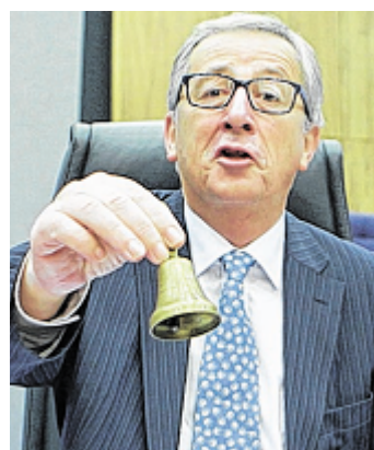
Soll nach dem Wirbel eine neue Ära einläuten: EU-Kommissionspräsident Jean-Claude Juncker.

EU-Parlamentarier drängen nach den „Lux-Leaks“ auf Transparenz und Abstimmung in Steuerfragen.