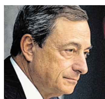
Mario Draghi reagiert vorerst nicht auf die niedrige Inflation.

Frankfurt – Europas Währungshüter arbeiten angesichts düsterer Aussichten für Wachstum und Inflation mit Hochdruck an weiteren Sondermaßnahmen. Die Vorbereitungen für zusätzliche Eingriffe seien weit fortgeschritten, sagte EZB-Präsident Mario Draghi am Donnerstag in Frankfurt. Notfalls könne die Notenbank rasch handeln. (dpa)