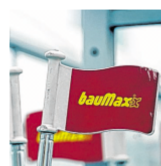
Die Kette Obi soll über einen bauMax-Kauf verhandeln.

Wien – Bei der angesprochenen Baumarktkette bauMax soll der Verkaufsprozess für Österreich, Tschechien und die Slowakei in vollem Gang sein, berichtet das Nachrichtenmagazin News. Bereits vor zwei Wochen sickerte durch, dass Deutschlands größte Baumarktkette Obi Gespräche mit den Gläubigerbanken führt. Bis 18. Dezember müssen Angebote vorliegen. (APA)