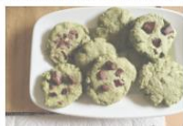
RECIPE: MATCHA COOKIES