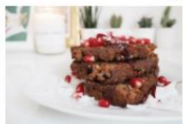
BANANA NUT BREAD FRENCH TOAST