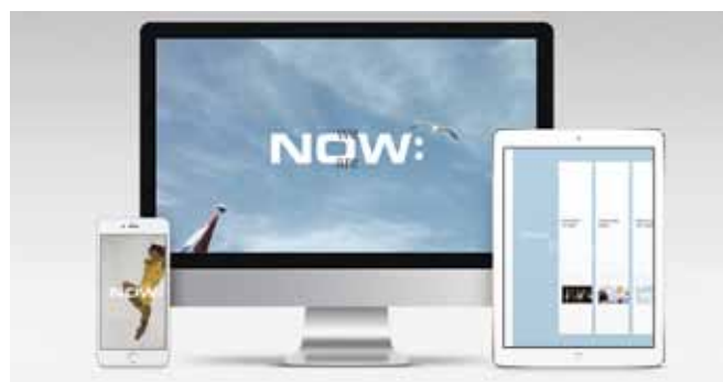
One-Stop-Shop Unnötige Schnittstellen auf Kundenseite werden maximal reduziert; konsequente Integration unterschiedlicher Kanäle.

temisch betrachtet, kann man heute Menschen im Kollektiv viel schwerer erreichen als noch vor zehn oder gar 20 Jahren. Die Fragmentierung der Medien und Zielgruppen bringt es mit sich, dass hauptsächlich Live-Events im Sport-, E-Sport- oder Entertainment-Bereich sowie außergewöhnlich inszenierte Projekte breitere Zielgruppen auf einer emotional positiven