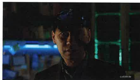
Die Verwandlung von Bestsellerautor Sebastian Fitzek in einen „Alptraum“ wirkte beim jungen Publikum.

TV-Spots mit Attributen wie „kraftvoll“ und „energiegeladen“ assoziierten, taten das danach 37 Prozent. Die größte Wirkung zeigte jedoch Audible mit seiner Kampagne: Die Marke war ohne den Spot nicht unter den Top drei. Die TV-Werbung brachte aber elf Prozentpunkte Zuwachs in Sachen „Kraft/Energie“, sechs Prozentpunkte Zuwachs bei „Besonderheit“ und fünf