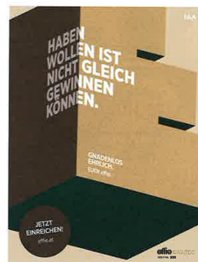
„Gnadenlos ehrliche“ Sprüche zieren die Sujets der Effie-Kampagne.

Neben den Branchenkategorien und dem Newcomer gibt es seit 2018 drei neue, nun nachgeschärfte, branchenübergreifende Kategorien: Positive Change für Maßnahmen/Kampagnen, die beweisen, dass ein effektives Businessmodell und Weltverbesserung kein Widerspruch sind; dazu die Kategorie Transformation, die Einreichungen für ihre Wirkung und Veränderung in der Branche auszeichnet, und die Kategorie Brand Experience für Konzepte mit einer optimalen Markenbotschaft. SWA