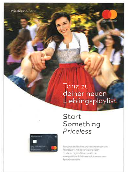
Die Kampagne „Mastercard Priceless Austria“ wurde 2018 mit Fokus auf die Landeshauptstädte sowohl am City Light als auch im Online-Bereich als interaktives Werbemittel eingesetzt.

Kunden von BrightScope können zudem die Out-of-Home-Kampagnen der Mitbewerber evaluieren lassen: Wo platziert die Konkurrenz, welches Produkt bewirbt sie und wie performen die Außenwerbe-Kampagnen der Mitbewerber im Vergleich zu den eigenen? Als Neukunden konnte BrightScope übrigens Raiffeisen NÖ-Wien gewinnen.