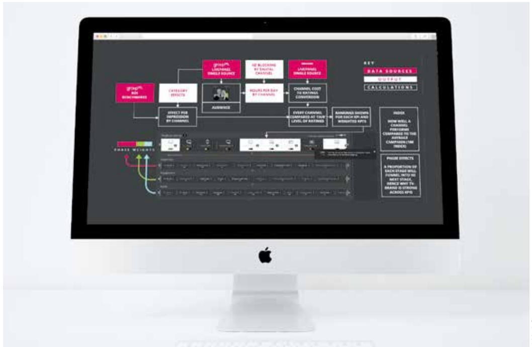
Mit dem MediaCom-System „Planner“ lassen sich Kampagnen einfach und übersichtlich organisieren.

sich Werbebotschaften durch eine gute Datenbasis und Messbarkeit grundsätzlich effektiver ausspielen lassen, ist es notwendig, ein umfassendes Brand Safety-Konzept zu haben, um Werbebotschaften nicht an Orten auftauchen zu lassen, wo sie nicht gewünscht sind. MediaCom hat dazu vor Kurzem ein eigenes Brand Safety-Tool vorge-