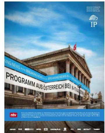
RTL-Group-Vermarkter IP setzt, obwohl selbst im TV daheim, gerne auf große Inserate in B2B-Zeitschriften.

sei darauf zu achten, eine durchgängige Konzeptidee über alle Kanäle zu ziehen und die relevanten Botschaften richtig miteinander zu verbinden. Eine neue Art des Storytellings werde nötig sein, um unterschiedliche Zielgruppen zu adressieren, ohne das Markenbild zu verwässern. Viele Printmedien hätten es geschafft, eine starke Onlinecommunity aufzubauen und die Zielgruppe in den digitalen Kanälen zu aktivieren. „Das gedruckte Magazin kann mit seiner Informationstiefe punkten und die digitalen Kanäle mit der Aktualität“, ergänzt Hettesheimer, „und somit die Vorteile der Kanäle bestens miteinander verbinden.“