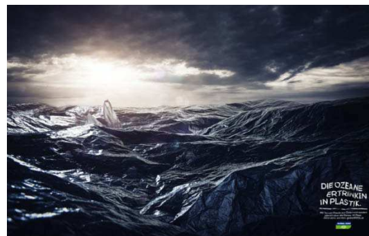
Selbst doppelseitige Inserate, wie hier von Heimat Wien und Havas Media für Global 2000, erfreuen sich immer noch großer Beliebtheit.

Für Magazine werde wesentlich sein, qualitativ hochwertige, gut recherchierte Inhalte zu liefern, um die Leserschaft und somit auch die Werber an sich zu binden. Da die Fragmentierung sehr weit fortgeschritten sei, werde es Verschiebungen geben, meint Hettesheimer zwar. „Aber jene Magazine, die sich auf die Kernwerte besinnen und diese crossmedial anbieten, werden Bestand haben.“