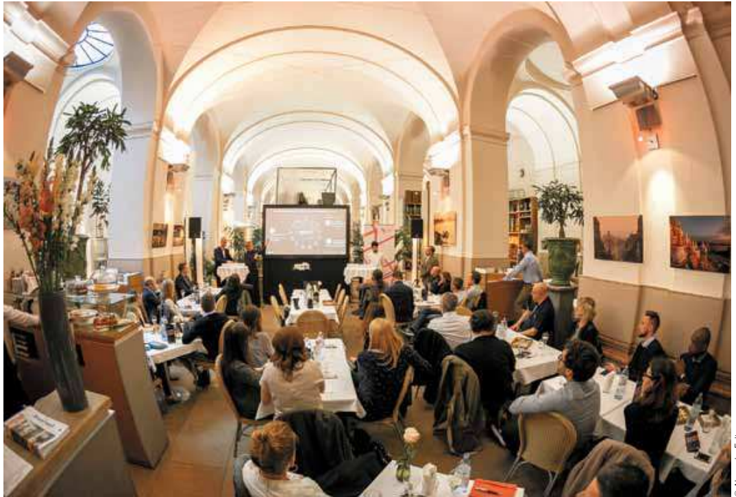
Gut besucht Die Studie wollten sich viele nicht entgehen lassen; das Ambiente im „Hansen“ in der Börse passte dazu.