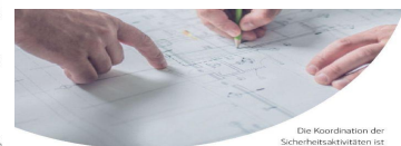
Die Koordination der Sicherheitsaktivitäten ist eine der wichtigsten Aufgaben.