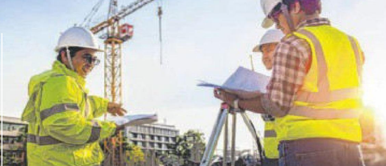
Arbeitsicherheit spielt eine immer wichtiger Rolle.